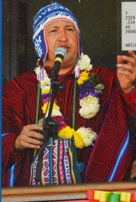
Hugo Chávez en Cochabamba, Bolivia, 26 de mayo, 2006

La unidad latinoamericana reúne los discursos más demostrativos que Hugo Chávez, Presidente de la República Bolivariana de Venezuela, ha dado entre 1999 y 2006 en países de América Latina y los Estados Unidos. Como promotor e incansable luchador por la transformación de la historia contemporánea de América Latina, Hugo Chávez habla ante universitarios, activistas, diplomáticos, trabajadores y su pueblo, dando a conocer su visión bolivariana y antiimperialista, llamando a la integración real de los pueblos del mundo, especialmente del Sur, con la idea de "construir el sueño de nuestros libertadores".