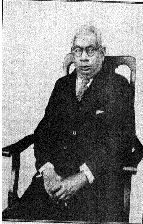
सर सी० वाई० चिंतामणि